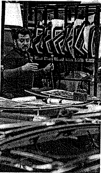
Los blindadores importan 90% de los materiales con los que se trabajan.

Las empresas que se dedican al blindaje de vehículos han encontrado un creciente mercado debido a los problemas de inseguridad que vive el país. Con la utilización de una tecnología de punta y de materiales ligeros, equipan unidades para proteger a sus tripulantes.