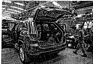
El blindaje de vehículos en el país es una industria que en los últimos diez años se cuadruplicó.

Las empresas que se dedican al blindaje de vehículos han encontrado un creciente mercado debido a los problemas de inseguridad que vive el país. Con la utilización de una tecnología de punta y de materiales ligeros, equipan unidades para proteger a sus tripulantes.