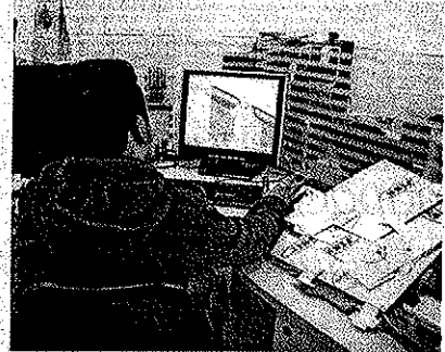
Los precios para blindar autos van desde los 34 mil dólares.